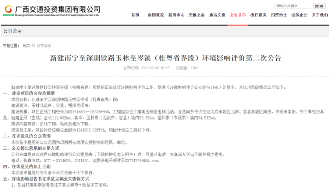
图 2 环境影响报告书征求意见稿网站公示

2021 年 02 月 08 日，项目建设单位在广西交通投资集团有限公司网站发布环境影响报告书征求意见稿公告公示（网址 http://www.gxjttzjt.com/ ），截图见图 2。