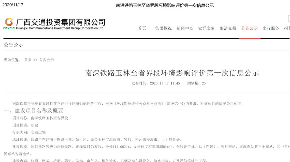
图 1 广西交通投资集团有限公司网站第一次公示

2020 年 11 月 17 日，广西交通投资集团有限公司在其网站（网址 http://www.gxjttzt.com/ ）进行首次环境影响评价信息公开，截图见图 1。