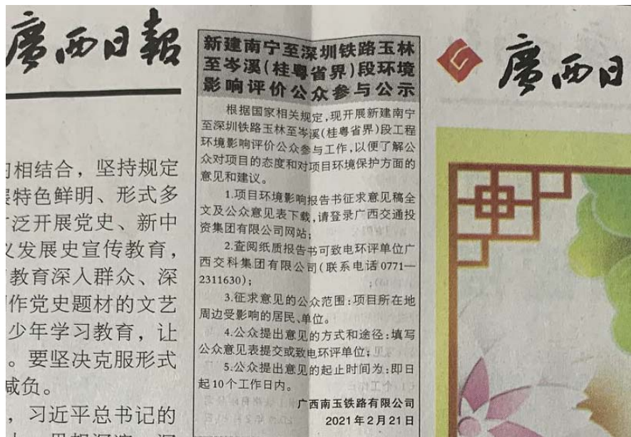
图 3 项目征求意见稿在第 25421 期《广西日报》第一次公示

建设单位分别于 2021 年 2 月 21 日及 2 月 22 日，在《广西日报》发布环境影响报告书征求意见稿公告公示，期号为第 25421 期以及第 25422 期。截图见图 3 及图 4。