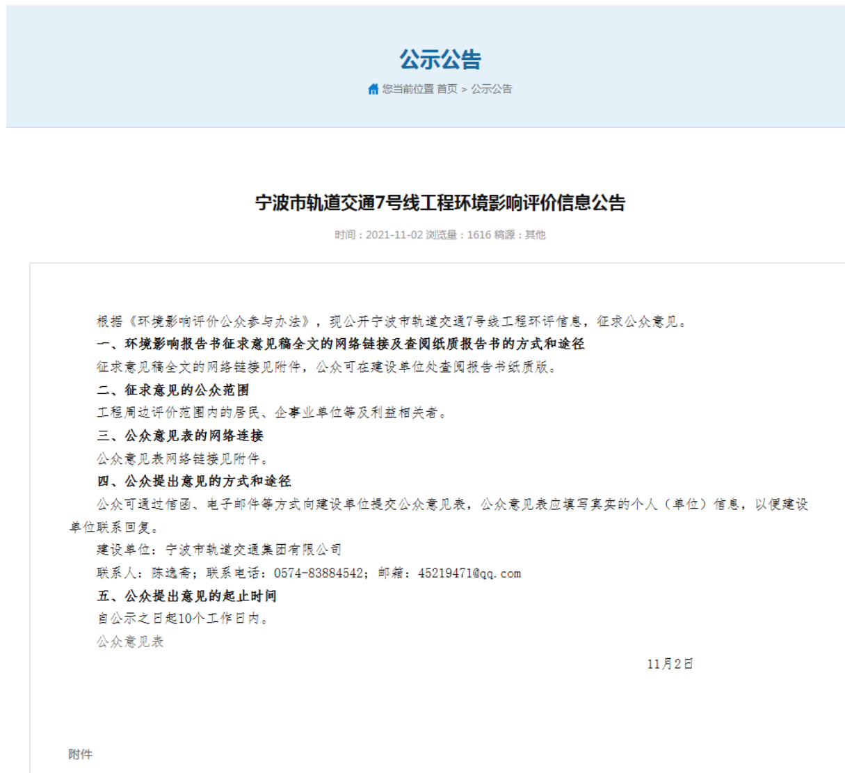
图 3-1 公司网站征求意见稿公示