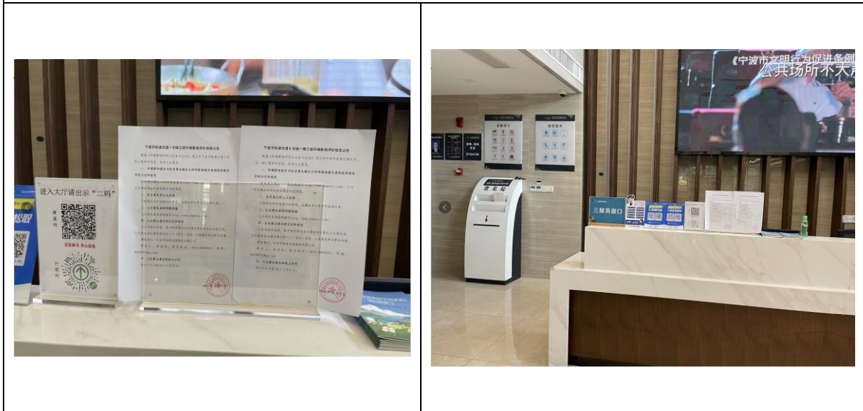
江北行政服务中心