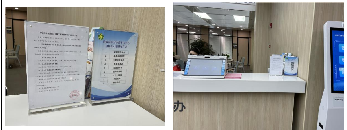
镇海行政服务中心