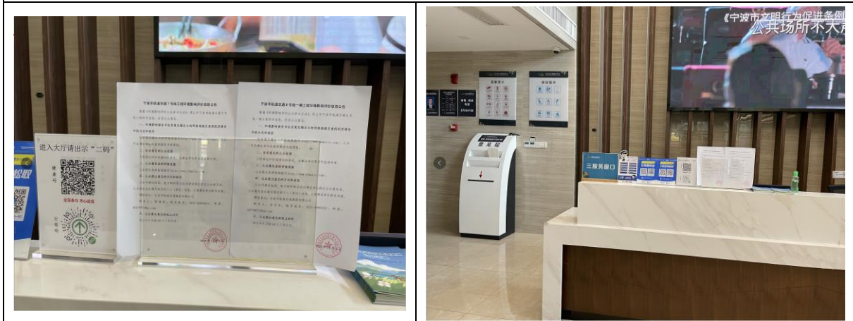
江北行政服务中心